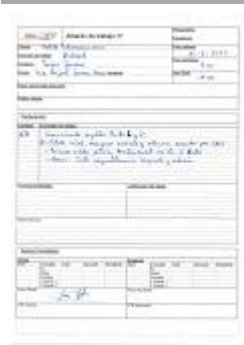
PARTE 15-02-2020.jpg 646K