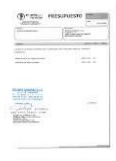
PORTILLO DINAMARCA 9815-PRESUPUESTO..jpg 458K