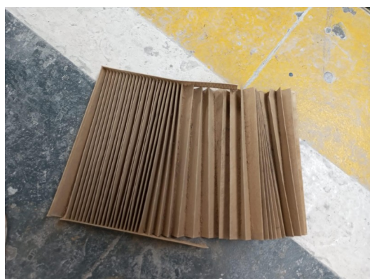
Estado filtro antipolen, filtro del habitáculo