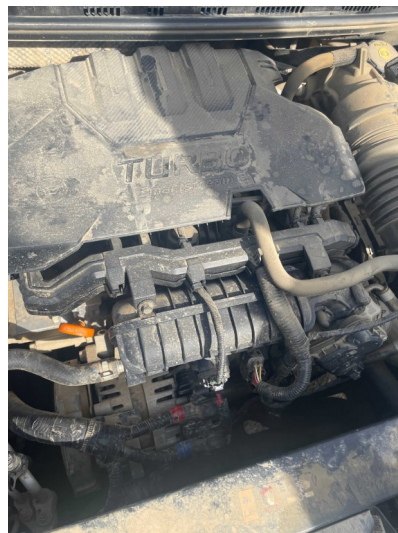
Suciedad en motor