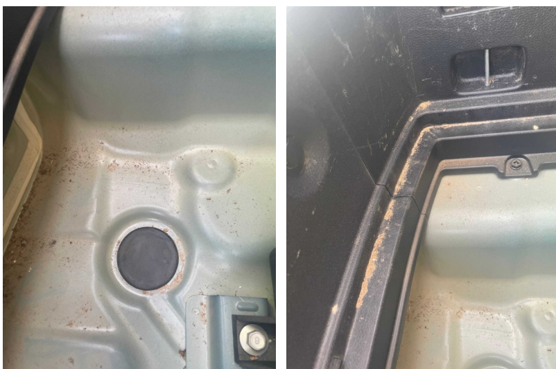
Polvo en maletero