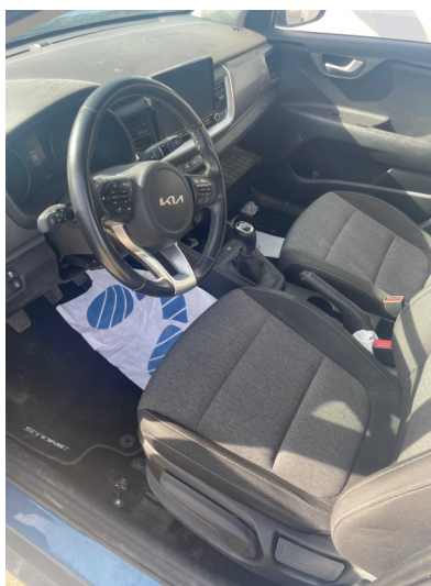
Vista parte delantera del vehículo