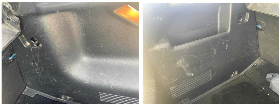
Daños en guarnecidos maletero