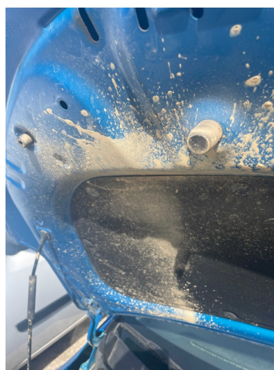
Suciedad en motor