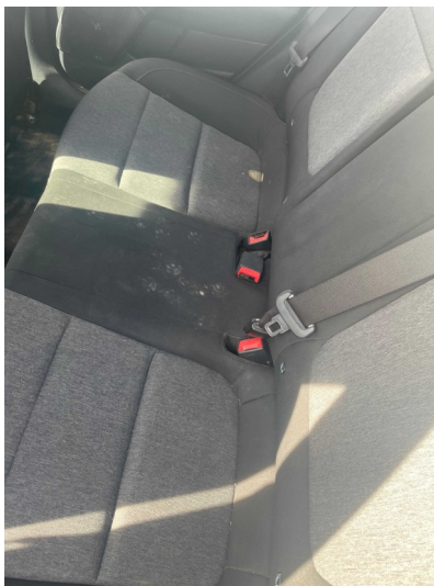
Vista de asientos traseros