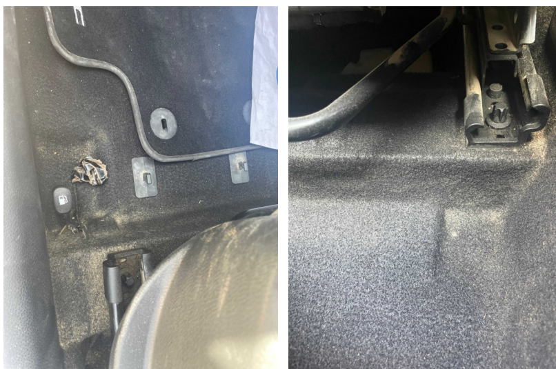
Vista parte delantera del vehículo