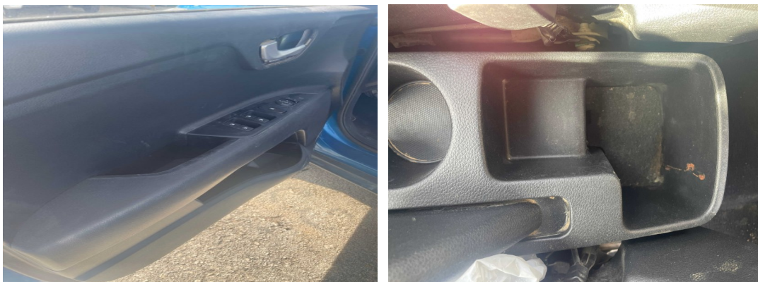
Vista parte delantera del vehículo