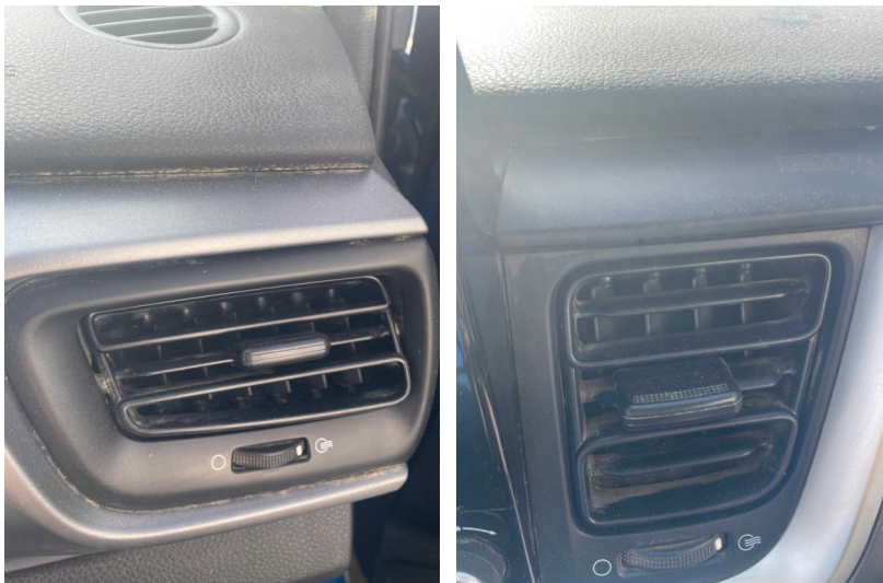
Vista de aireadores, con restos de polvo