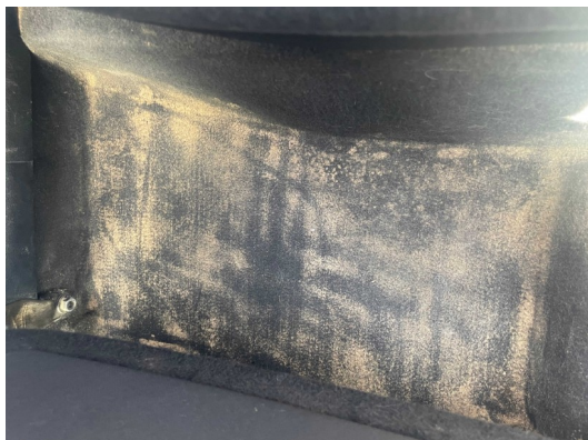
Vista de moqueta trasera