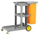
Carro de limpieza